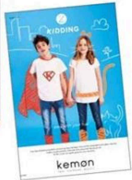
"Perché, anche coi capelli, giocare è una cosa seria". Questo il claim per il lancio del nuovo segmento Liding Kidding by Kemon studiato per le esigenze dei più piccoli.