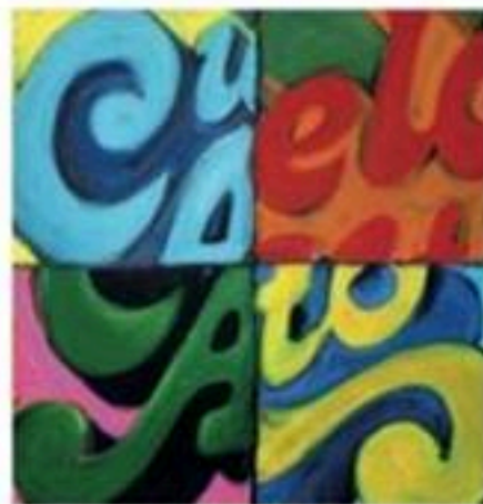
L'azienda opera nel mercato sui due canali: professional e consumer.

Cinquanta candeline per Soco, l'azienda che nasce nel 1969 a Torino, dove ha tuttora sede e stabilimento produttivo: la fondazione dell'azienda coincide con la creazione della lacca Cielo Alto, senza gas, un prodotto che ha fatto la storia.